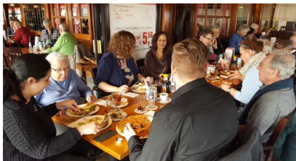
Foto's: vrijwilligers samen met Maison Patrick gasten en hun partners bij pannenkoekenhuis 'Oude Maas' in Barendrecht.

Op 9 maart wilden onze vrijwilligers op een feestelijke wijze hieraan aandacht besteden. Alle vrijwilligers waren betrokken om de gasten van Maison Patrick, maar zeker ook de mantelzorgers een ontspannen dagje uit te bezorgen. In de vroege morgen verzamelden de gasten zich met hun mantelzorgers bij het Respijthuis. Vanuit hier werd de zorg overgedragen aan de enthousiaste vrijwilligers. Samen met ondersteuning van twee chauffeurs van Sjtuttul Waardeburch werd er met twee bussen gereden richting pannenkoekenhuis 'Oude Maas'. Bij aankomst werd iedereen in bezit van een rolstoel-rollator-stok handtas muts of sjaal vriendelijk onthaald. De hartverwarmende sfeer benadrukte het familiair gevoel van het gezelschap. De ene pannenkoek na een ander werd op tafel geserveerd, door onbezorgd tafelen was er even paniek of de volgende bestemming op tijd kon gehaald worden.